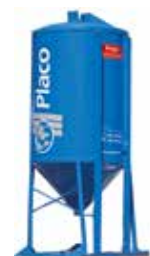
Silos (a granel)